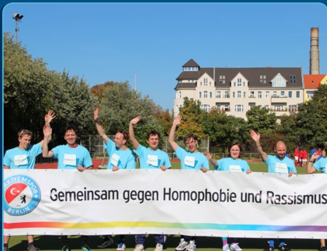
Freundschaftsspiel zwischen Türkiyemspor und einer Mannschaft des LSVD