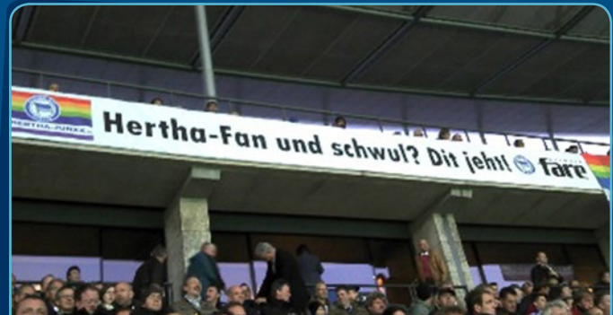
Banner der Hertha Junxx im Olympiastadion

QFF ist ein Netzwerk europäischer schwul-lesbischer Fußball Fanclubs, welches 2006 gegründet wurde. Die QFF wenden sich gegen jegliche Diskriminierung, insbesondere die aufgrund der sexuellen Orientierung. Es ist den QFF ein besonderes Anliegen, weitere Gründungen schwul-lesbischer Fanclubs zu fördern und diese bei der Integration in die jeweilige Fanszene zu unterstützen. In Berlin wird QFF von den „Hertha Junxx“ vertreten, die bei ihrer Gründung 2001 der erste schwul-lesbische Fanclub in ganz Deutschland waren.