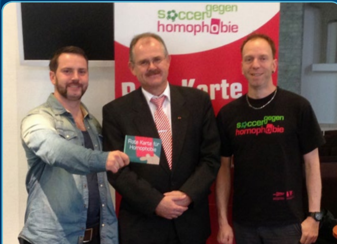
BFV-Präsident Bernd Schultz auf dem Verbandstag