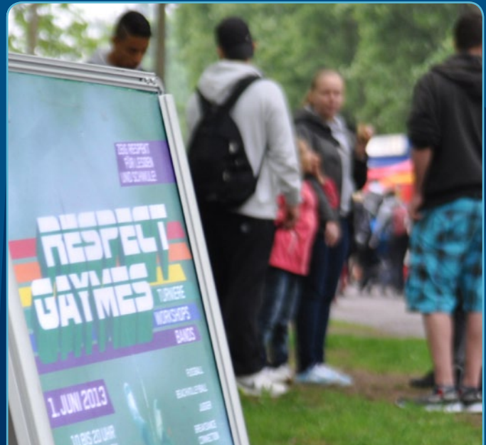
Respect Gaymes 2013

Durch medienwirksame Maßnahmen wird der Aufruf der Respect Gaymes für mehr Respekt gegenüber homosexuellen, bisexuellen und transidenten Menschen zusätzlich verbreitet.