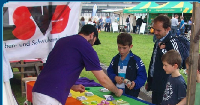
Informationsstand von Soccer Sound beim Präventionstag des BFV

Das Projekt SOCCER SOUND wurde im Juni 2010 gegründet und hat die Aufgabe, im Bereich Sport mit dem Schwerpunkt Fußball für das Thema „Vielfalt“ zu sensibilisieren und gegen Vorurteile und Homophobie anzugehen. Das Projekt arbeitet gezielt innerhalb der Vereine gegen Vorurteile und wirbt für Toleranz und Respekt. Mit Workshops für Jugendliche, Fortbildungen für Vereinsverantwortliche und Diskussionsveranstaltungen mit den Vereinen werden Aktive für die Themen Geschlechterrollen und Homosexualität sensibilisiert.