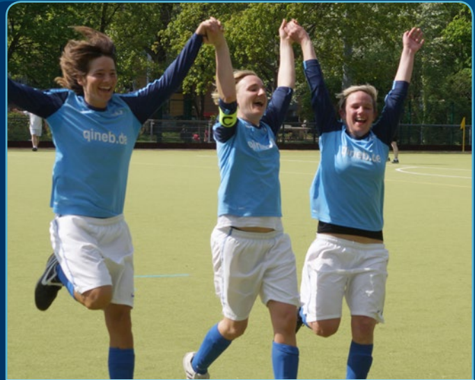
Spielerinnen von Seitenwechsel Berlin

In vielen Städten haben seit den 80ern Schwule und Lesben eigene Vereine gegründet, da sie sich oftmals in anderen Vereinen nicht wohl und akzeptiert fühlten. Auch in Berlin gibt es mit Vorspiel und Seitenwechsel zwei solche Vereine, in denen auch Fußball gespielt wird. Bereits seit 1988 existiert der „Sportverein für FrauenLesbenTrans* und Mädchen e.V.“. Seitenwechsel, der mittlerweile mit 850 Mitgliedern in über 20 Sportarten der weltweit größte Verein seiner Art ist. Vorspiel wurde 1986 zunächst als rein schwuler Sportverein gegründet, seit 1993 sind dort auch Frauen aktiv. Offiziell wurde der Verein 1998 auf einer Mitgliederversammlung für Frauen geöffnet und zählt mittlerweile fast 1.100 Mitglieder. Beiden Vereinen ist gleich: Neben dem alltäglichen Sportbetrieb engagieren sie sich durch vielfältige Aktivitäten für die Rechte von Homosexuellen und nicht jedes Mitglied muss selbst lesbisch, schwul oder bisexuell sein, es muss sich nur mit den Vereinszielen identifizieren.