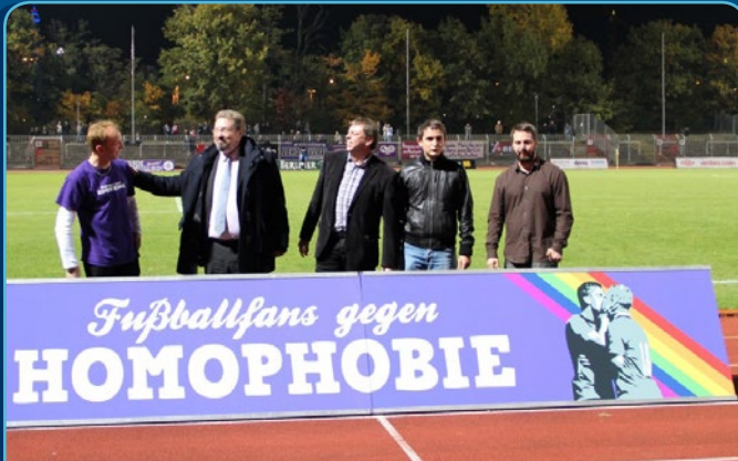
Einweihung der Fußballfans gegen Homophobie Bande im Mommsenstadion