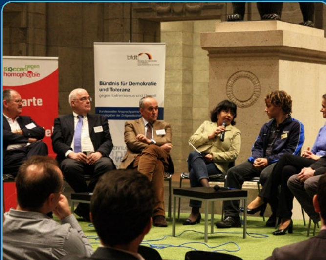
Podium auf dem 3. Fachtag „Vereine stark machen“