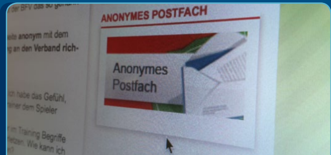
Anonymes Postfach des BFV auf www.berliner-fussball.de/soziales

Der BFV hat im Januar 2011 das so genannte „Anonyme Postfach“ ins Leben gerufen. Mit Hilfe dieses Postfaches kann jeder Besucher und jede Besucherin der BFV-Internetseite, etwa bei Fragen und Problemen zu Diskriminierung auf Grund der sexuellen Identität oder zum Thema „Coming-out“, anonym mit den Verantwortlichen des BFV und von SOCCER SOUND Kontakt aufnehmen und sich beraten und helfen lassen.